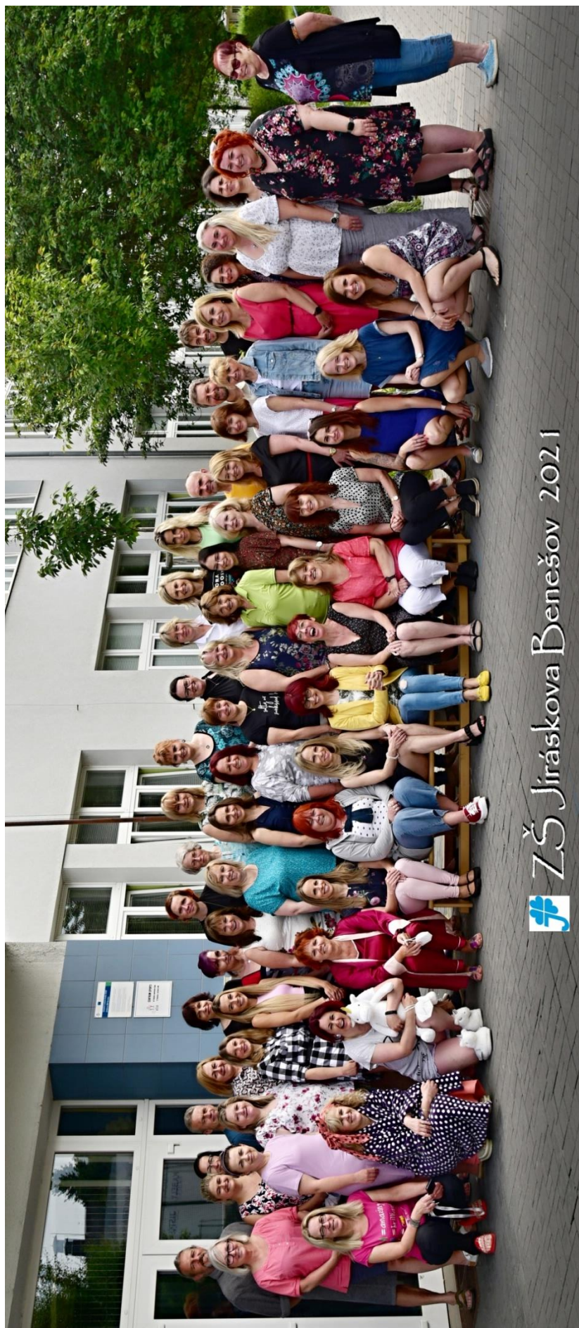
ZŠ Jiráskova Benešov 2021