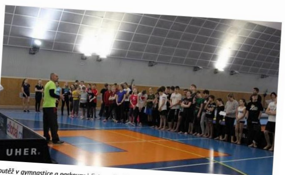
Soutěž v gymnastice a parkouru

Žáci od šestých ročníků základních škol si mohou prověřit svou kondici a připravenost na Gymnastické všestrannosti a parkourové soutěži, kterou pořádá ve spolupráci s Domem dětí a mládeže Benešov Základní škola Jiráskova Benešov 27. února.